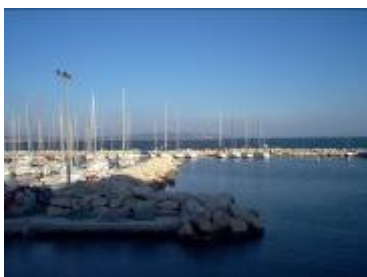
Le Lycée Arthur Rimbaud Istres

Le Lycée Arthur RIMBAUD : Depuis la rentrée 2007, le Lycée Arthur RIMBAUD d'Istres accueille la plus grande partie des élèves du Pôle Espoir Handball. Il compte également un « Pôle excellence Voile », une filière « Option Sport » et de nombreux sportifs de toutes disciplines. Dès 2010, les élèves de seconde du Pôle Espoir ont pu bénéficier d'un aménagement horaire dans le cadre de la nouvelle expérimentation des rythmes scolaires.